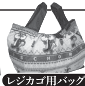
レジカゴ用バッグ