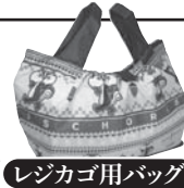
レジカゴ用バッグ