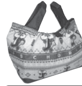
レジカゴ用バッグ