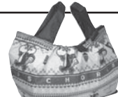
レジカゴ用バッグ