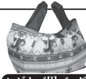
レジカゴ用バッグ