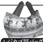
レジカゴ用バッグ