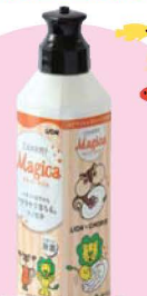
「LION」コラボ ちよリス 食器用洗剤Magica