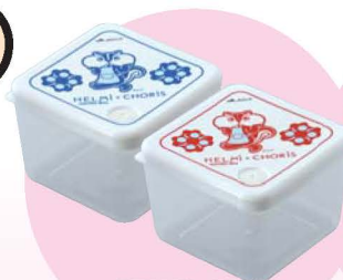
「HELMY」コラボ ちよリス フードコンテナセット