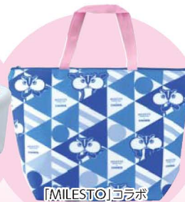
「MILESTO」コラボ ちよリス 保冷トートバッグ